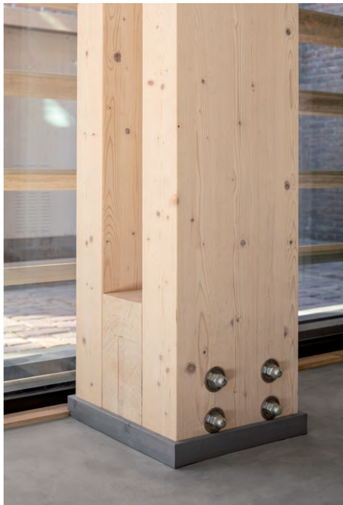
Om het gebouw optimaal remontabel te houden zijn overal de moeren en de bouten in het zicht gelaten.