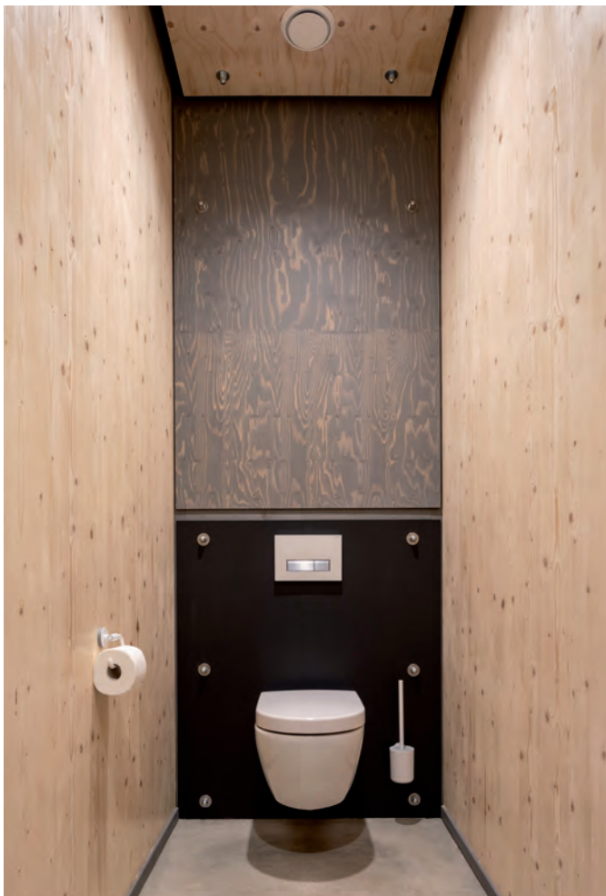
De wand achter het toilet bevat niet alleen een spoelbak en benodigd leidingwerk: alle centrale leidingen en voorzieningen zitten achter de met lijnolie gebeitste wand.