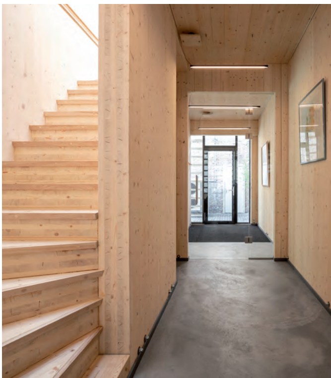
De lichtval is, mede door de lamellen heel subtiel. Ook de keuken is remontabel. Let op de slanke LED-lichtarmaturen.